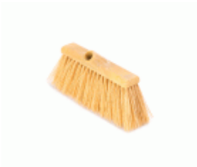
BARRENDERO BARBOSA RECICLADO PROFESIONAL AMARILLO 30 Ref.1625