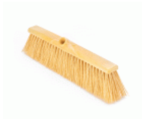
BARRENDERO BARBOSA RECICLADO PROFESIONAL AMARILLO 50 Ref.1627