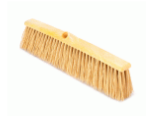
BARRENDERO BARBOSA RECICLADO PROFESIONAL AMARILLO 60 Ref.1628