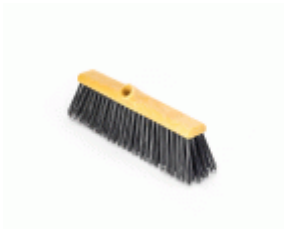
BARRENDERO BARBOSA RECICLADO NEGRO 40 Ref.1571