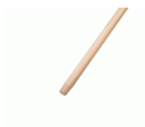
MANGO BARRENDERO MAD.GALLEGA 1300x28 C/R Ref.1987