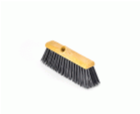
BARRENDERO BARBOSA RECICLADO NEGRO 30 Ref.1570