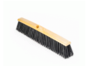
BARRENDERO BARBOSA RECICLADO NEGRO 60 Ref.1573