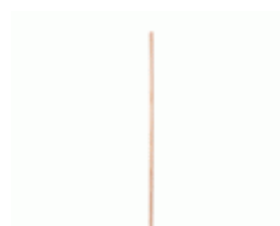
MANGO BARRENDERO MADERA GALLEGA 1500x28 Ref.1997