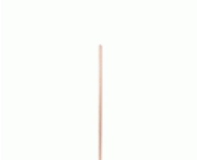
MANGO BARRENDERO MAD.GALLEGA 1200x28 S/ROSCA Ref.1994