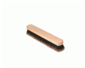
BARRENDERO BARBOSA MADERA MEZCLA DESPUNTADO 43 Ref.1539