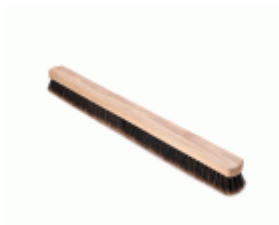
BARRENDERO BARBOSA MADERA MEZCLA DESPUNTADO 86 Ref.1542