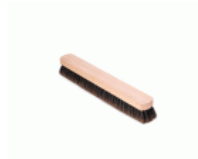
BARRENDERO BARBOSA MADERA MEZCLA DESPUNTADO 52 Ref.1540