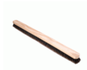
BARRENDERO BARBOSA MADERA MEZCLA DESPUNTADO 104 Ref.1543