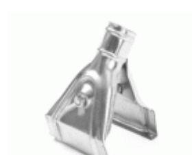
GARRA ESPECIAL BARBOSA Ref.1500