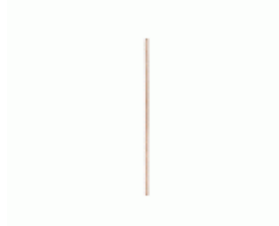
MANGO BARRENDERO MAD.GALLEGA 1300x28 S/ROSCA Ref.1995