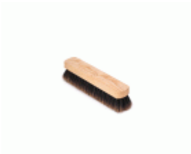
BARRENDERO BARBOSA MADERA MEZCLA DESPUNTADO 34 Ref.1538