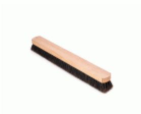
BARRENDERO BARBOSA MADERA MEZCLA DESPUNTADO 61 Ref.1541