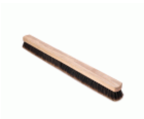
BARRENDERO BARBOSA MADERA MEZCLA DESPUNTADO 86 Ref.1542