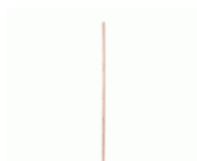
MANGO BARRENDERO MADERA GALLEGA 1500x28 Ref.1997