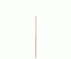
MANGO BARRENDERO MAD.GALLEGA 1200x28 S/ROSCA Ref.1994