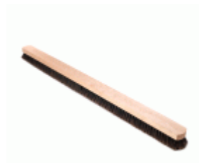
BARRENDERO BARBOSA MADERA MEZCLA DESPUNTADO 120 Ref.1544