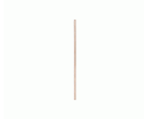
MANGO BARRENDERO MAD.GALLEGA 1300x28 S/ROSCA Ref.1995