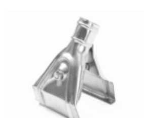
GARRA ESPECIAL BARBOSA Ref.1500