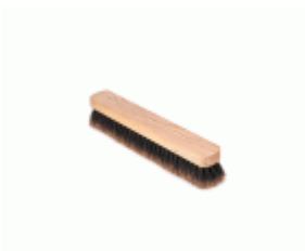
BARRENDERO BARBOSA MADERA MEZCLA DESPUNTADO 43 Ref.1539