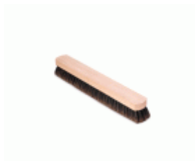
BARRENDERO BARBOSA MADERA MEZCLA DESPUNTADO 52 Ref.1540